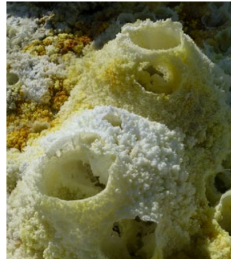
Couverture: Dallol