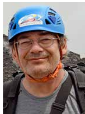
Texte et Photos Pierre Rollini

Dimanche 29 juillet. Vol très matinal sans histoire sur Catane. Le fait d'atterrir vers 8h du matin nous permet une belle vue de l'Etna, qui semble dégager pas mal de gaz, sans qu'il soit possible de définir précisément à partir de quel(s) cratère(s). Après avoir pris possession de nos deux voitures, nous prenons la direction