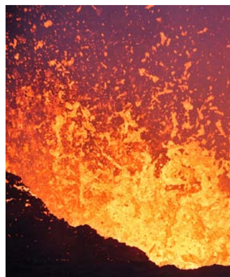
Première page : Lac de Lave au Plosky Tolbachik