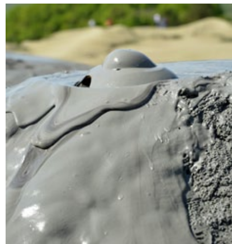
Couverture: Volcan de boue en Roumanie